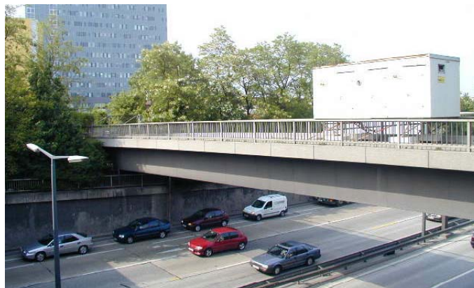
Bild 1. Ansicht der PORR Brücke

desministerium für Bauten und Technik den Forschungsauftrag zur Errichtung eines Brückentragwerkes in Segmentbauweise mit geklebten und vorgespannten Stößen über die A23 Südosttangente Wien. Das einfeldrige Tragwerk mit Kastenquerschnitt und einer Stützweite von 44,01 m wurde aus 18 Fertigteilsegmenten zu je 2,48 m Länge hergestellt (Bild 1). Das Tragwerk bot bei einer Gesamtbreite von 6,2 m eine Fahrbahnbreite von 4,8 m. Der einzellige Hohlkasten wies eine konstante Stegstärke von 40 cm und eine Konstruktionshöhe von 2,10 m auf. Die Kastenbreite betrug 3,80 m, womit eine Auskragung der Fahrbahnplatte beiderseits mit 1,20 m verblieb. Die Vorspannung bestand aus 6 Hilfsspanngliedern, die im Bauzustand zum Zusammen-spannen der Segmente verwendet wurden, und aus 20 Spanngliedern zur Aufbringung der vollen Vorspannung. Die Verbindung der einzelnen Segmente wurde mit einer 2 mm dicken Epoxidharzklebefuge hergestellt. Nach Aufbringen der Hilfsvorspannung stellte sich eine Fugendicke von ca. 0,5 mm ein. Nach Abschluss der Spannarbeiten wurden die verzinkten Stahlwellblech-Hüllrohre verpresst und die Hilfsspannglieder entspannt. Der Fahrbahnaufbau setzte sich aus einer 1 cm dicken Bitumenabdichtung und einer 6 cm starken Asphalt-schicht zusammen.