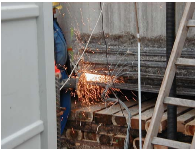
Bild 3. Durchtrennen der Spannkabel

chen der Fließgrenze des Spannstahls am Ende des 9. Belastungsversuchs möglich. Die danach sehr rasch ansteigenden Verformungen im letzten Belastungstest kündigten das Versagen der Brücke an. Dies spiegelten die Messergebnisse der Betondehnung sowie der Fugenöffnungsweiten wider. Bei den Segmentfugen war feststellbar, dass die entstandenen Risse zufolge der Belastungsversuche nicht in der Epoxidharzfuge auftraten, sondern der Beton unmittelbar neben der Segmentfuge riss.