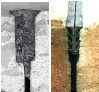
Abbildung 2: Unterschiedlicher Fugenverschluss (links: Fugenverschluss, rechts: Fugenprofil)

Um das Eintreten von Feinteilen zu verhindern, müssen auf hochbelasteten Straßen alle Fugen verschlossen werden (Abbildung 2). In Österreich hat sich durchgesetzt, dass Quersfugen mit einem Fugenprofil zu verschließen und Längsfugen bituminös zu vergießen sind.