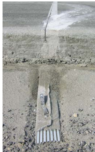
Abbildung 3: Flachdrän auf eingefräster bituminöser Unterlage unter Betondecke

Um den Haftverbund zwischen bituminöser Unterlage und Betondecke langfristig sicher zu stellen, muss die bituminöse Unterlage vor dem Betoneinbau gründlich gereinigt werden. Ein leichtes Anfräsen der Oberfläche ist nach Meinung der Experten für den Haftverbund und somit für die Langlebigkeit der Betondecke empfehlenswert, insbesondere wenn über die bituminöse Unterlage längere Zeit der Verkehr geführt wurde oder bei Steigungsstrecken.