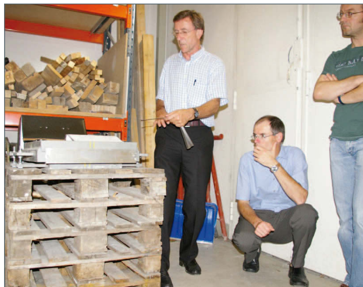
Praktische Übung im Prüflabor des Instituts für Tragkonstruktionen

Auf Initiative der Arbeitsgruppe Brückenbau, unter der Leitung von Senatsrat Winter, wurde die Schulung „Brückeninspektoren“ ins Leben gerufen. Nachdem im Jahr 2008 die Basisschulung begonnen wurde konnte 2009 der Aufbaulehrgang sehr erfolgreich den Lehrgang ergänzen. Dieser Aufbaukurs beinhaltet neben einer Vertiefung wichtiger Punkte auch eine praktische Übung im Prüflabor des Instituts für Trag-