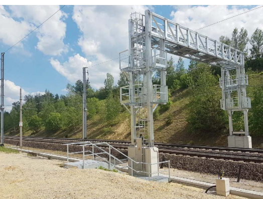
3: Zuglaufcheckpoint Wachberg – Ladungsmessanlage

Die an den Standorten erfassten Messdaten werden außerdem in Echtzeit an das Portal „Infra-INFO-Hub“ übermittelt. Das Portal und die im Hintergrund eingesetzte, innovative Technologie bildet die Basis, um vorhandene Daten aus unterschiedlichsten