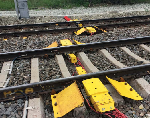
2: HOA - Heißläuferortungsanlagen Temperatur Messung von Achslager, Bremscheiben und Radkränzen