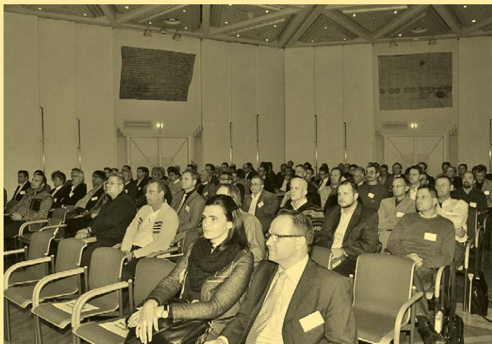
Abb. 2: Brückenprüfer Erfahrungsaustausch

weiteren Vergleich mittels relativer Kennzahlen unterzogen. Es zeigte sich, dass in beiden Fällen ein algorithmusgestütztes Szenario die besten Ergebnisse erzielte, jedoch keine Aussage darüber gemacht werden kann, ob der 10- oder der 15-Minuten-Grundtakt besser ist. Eine Vereinheitlichung auf das gesamte Grazer Liniennetz ist jedoch bedeutend einfacher möglich, wenn der Südwesten bereits auf eine einheitliche Taktfamilie gebracht wurde.