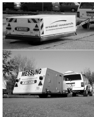
Abb. 4: Rollgeräuschmessanhänger von arsenal research (oben: RVS, unten: ISO/CPX)

Daher wurde von der ISO ein Nahfeld-Messverfahren entwickelt, das eine Beurteilung der Fahrbahndecke in einfacherer Weise ermöglicht. Dieses liegt als Normentwurf ISO/CD 11819-2 [8], kurz als Close-Proximity-Verfahren (CPX) bezeichnet, vor. Ar-