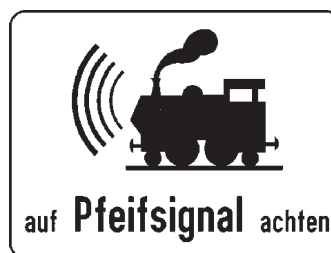
Abb. 1: Zusatztafel: „auf Pfeifsignal achten“

In der RVS 03.06.13 werden Maßnahmen für eine barrierefreie Ausführung von nicht-technisch gesicherten und technisch gesicherten EK festgelegt. Es wird dabei in allgemeine Maßnahmen, die bei jeder derart auszustattenden EK erforderlich sind, und in zusätzliche Maßnahmen für die jeweilige Sicherungsart unterschieden. So gilt allgemein, dass eine ausreichende Aufstellfläche für Fußgänger herzustellen und mit einem Aufmerksamkeitsfeld gemäß ÖNORM V 2102-1 zu versehen ist. Für die Sicherungsart Andreaskreuze und Abgabe akustischer Signale vom Schie-