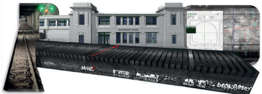
1: Links: Test der Laservermessung durch Drohne in einem Bauwerk der U-Bahn Wien. Mitte: Ergebnisse der Laservermessung: Zu sehen ist das U-Bahn-Stationsbauwerk Gumpendorfer Straße sowie ein U-Bahn-Tunnelbauwerk der Betriebslinie U4. Rechts: Test der Weiterverarbeitung der 3D-Punktwolke mittels Spezialsoftware