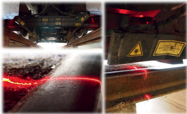
2: Laservermessung von Schienen

lange Zeitreihen (und die darin zu beobachtbaren Muster in der Fehlerfortschreibung – je nach Fehlerkategorie) erlauben es, Vorhersagen über die weitere Fortschreibung von Fehlern, prognostizieren zu können. Je nach Prognose, können so vom Management, zielgerichtet, strategische Maßnahmen im Asset Management getroffen werden.