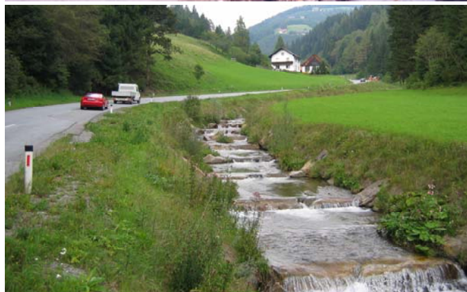
Zerstörter Straßenabschnitt (oben) - Sanierung durch Steinsohlschwellen und beidseitige Grobstreusenschichten (unten)

gen für Bauleistungen an Straßen sowie den damit im Zusammenhang stehenden Landschaftsbau“ vorgestellt – die Beschreibung der RVS findet sich in FSV-aktuell, Ausgabe Juli 2005)