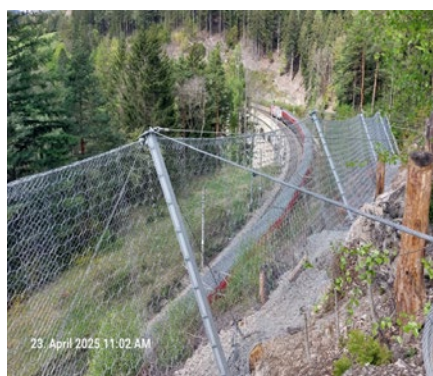
2: Schutznetz mit Fundierung nach RVS 08.22.02

erhaftigkeitseigenschaften der Fundierung nachteilig beeinflussen. Um diesen Einflüssen bedarfsgerecht und auch nachhaltig entgegenzuwirken, werden konstruktive Vorgaben und Bestimmungen an das Mikropfahlsystem der Fundierung - bestehend aus Traggliedern, Abstandhaltern, Muffen, Bohrkronen - und vor allem an die Ausbildung von Pfahlkopfanschlüssen und den Verpresskörpern definiert. Ein Schwerpunkt liegt hierbei in der richtigen Wahl des Mikropfahlsystems in Abhängigkeit des Baugrundes und dessen Eigenschaften.