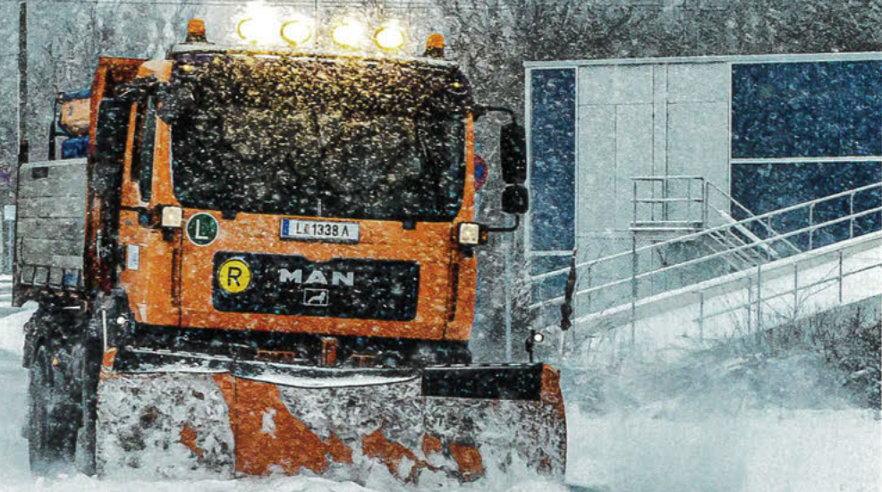
Bei winterlichen Fahrbedingungen sind Wegehälter (Wegehälterhaftung § 1319a ABGB), egal ob privat oder öffentlich, gefordert, Straßen und Wege von Schnee und Eisglätte freizuhalten. Die Befahrbarkeit und die Verkehrssicherheit haben oberste Priorität.